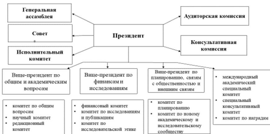
Рис. 2. Структура Корейской ассоциации региональной науки

минаре могут все желающие, не только члены одной из четырех организаций, спонсирующих это мероприятие. На данный момент было проведено 10 семинаров, два из них проводились в Корее – 4-й в Сеульском университете в 2014 г. и 8-й – в Национальном университете Чеджу (г. Чеджу) в 2018 г. [Asian Seminar].