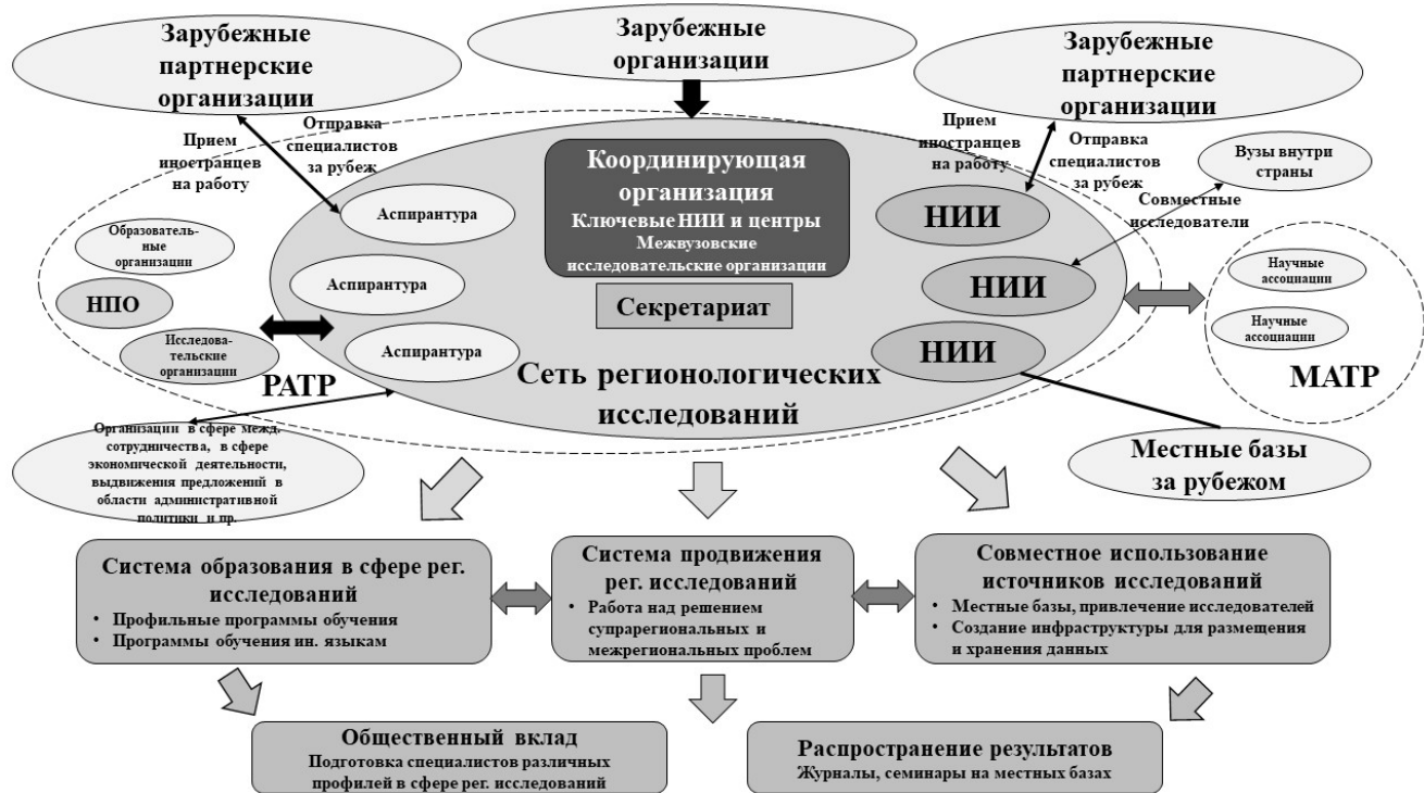
Рис. 2. Сетевые регионологические исследования