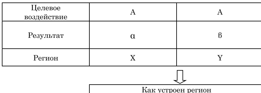
Рис. 4. Схема применения метода сравнительного регионального исследования

Японский региолог Синъити Сигэтоми в работе «Очерк сравнительных региональных исследований» [109, р. 26] предлагает общую схему применения сравнительного метода в региологических исследованиях, соответствующую описываемому типу исследований (рис. 4).